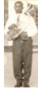
Baly cu su Sousaphone

Remarcabel ta e echo cu tur tocado por a lesa musica