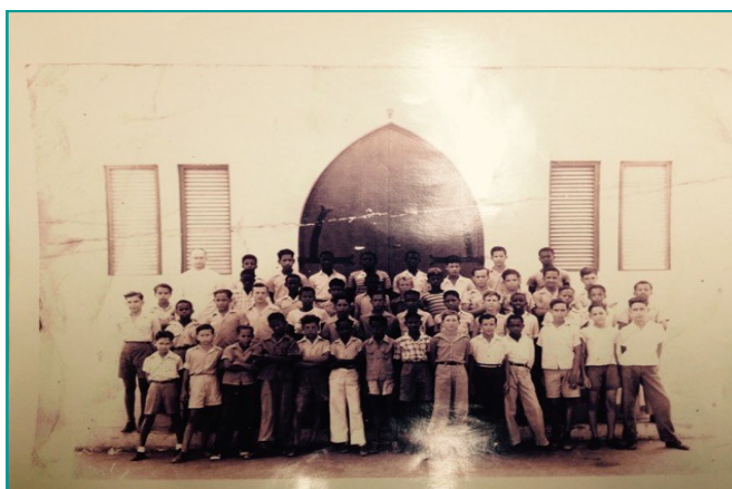
Tempo di Frerenan

Baly su sugerencia relaciona cu nos futuro generacion ta cu nan mester introduci lesnan di musica bek na scolnan pa nan. Bo ta haya awor aki un falta di comunicacion tambe. E mayor no ta busca pa hincá su yiu den un sport. E no ta hunga bala cu su yiu. Nos tabata traha y hunga cu trom tempo nos ta chikito. Nos tabata traha un fli. Awor nan ta djis cumpra un fli. E parti creativo pa haci of construi algo abo mes, lastimamente no t'ey mas.