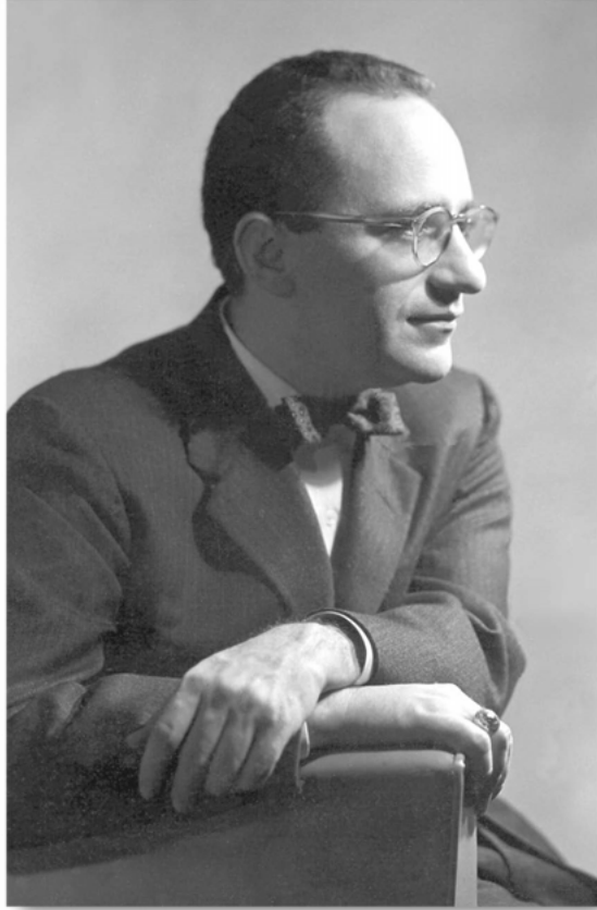
MURRAY N. ROTHBARD